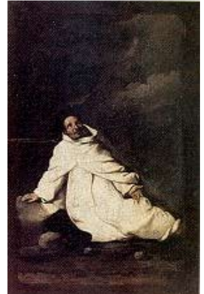
Saint Bruno (école de Le Sueur) à Saint-Benoît (à g.) et Martyr chartreux (école de Zurbarán) au musée Goya (à d.).