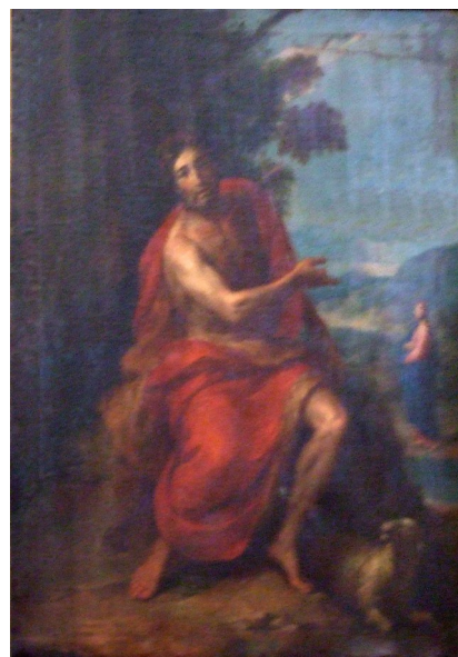
Saint Jean-Baptiste au désert (école de Le Sueur ?) - Cathédrale Saint-Benoît.

Le tableau de l'église Saint-Jacques représente saint Bruno en prière . Né en Allemagne vers 1030, Bruno poursuivit ses études à Reims, y devint chanoine de la cathédrale, recteur