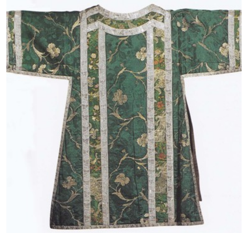
Dalmatique vert (vers 1720)

une chasuble, deux dalmatiques et une étole en un riche tissu dit persienne , datables de 1720-1725 : sur un fond abricot aux reflets cuivrés s'inscrivent dans un réseau complexe de dentelles de grosses fleurs brochées d'argent dont le centre est composé d'un