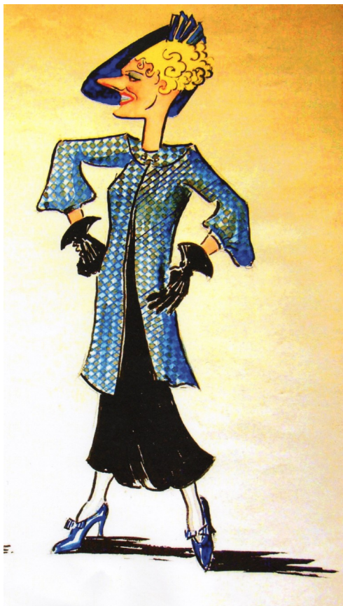
Géraldine, par Pierre Rivemale 1945, Musée Goya

Ses distinctions : en dehors de dizaines de distinctions poétiques et littéraires, elle reçut la médaille de la Résistance (ancien combattant ayant participé à la libération de Toulouse), devint chevalier des Palmes académiques. Son appartenance à de multiples sociétés savantes, nous prouve combien elle était appréciée et estimée. Nous devons à sa grande créativité des romans, des œuvres en poésie, autant d'œuvres qui lui valurent plusieurs prix littéraires.