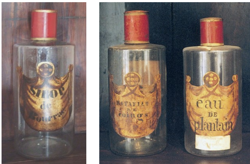
Le flacon restitué et deux de ses congénères de la Villégiale.

Il est possible que d'autres personnes soient en possession de pots ou flacons provenant de cette collection en partie dispersée au cours des temps. Le Société culturelle remercie par avance toutes celles qui voudraient s'inscrire dans une démarche analogue de restitution. Elles peuvent prendre contact à cet effet avec elle (tel : 05 63 35 31 50 ou scpc@sfr.fr ).