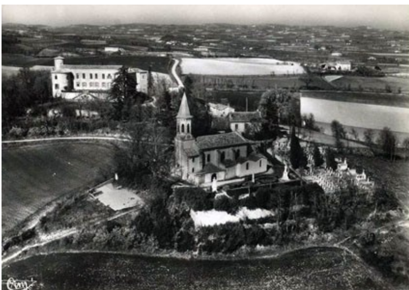
L'Eglise de Cuq les Vielmur