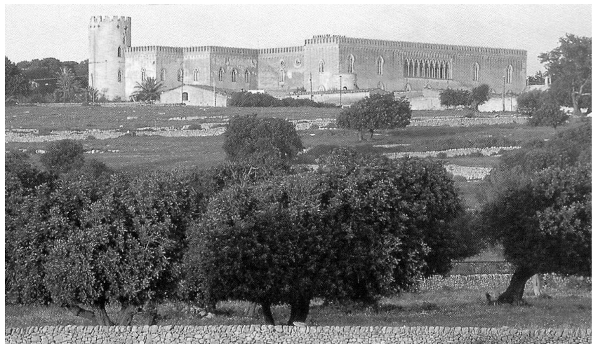
Le château de Donnafugata