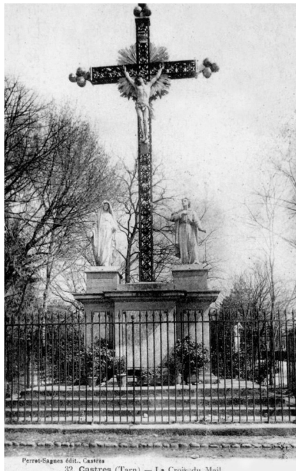
Berrot-Sagnes éd., Castres 32. Castres (Tarn) — La Croix du Mail

quiert alors une magnifique statue en marbre blanc de l'artiste castrais Jules Cambos au prix de 3 000 F. Cette statue appelée Le Retour du printemps est placée sur un socle en pierre du Sidobre à gauche de la porte d'entrée du jardin. Elle a été préalablement présentée en 1885 à l'exposition universelle d'Anvers, où elle a obtenu la médaille d'or. Elle a été exposée en 1889 à Paris puis en 1893 à Chicago, où elle a remporté à chaque fois la médaille d'argent. Elle est déplacée en 1963 à l'autre extrémité du jardin puis retirée pour la protéger du vandalisme.